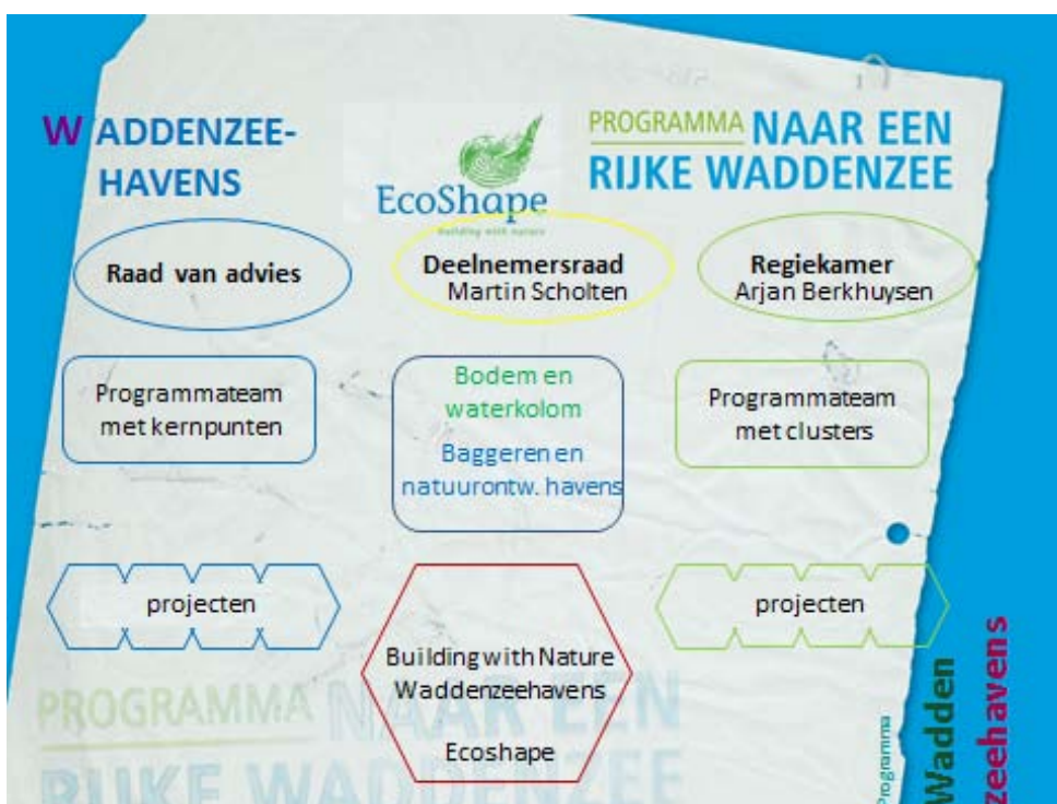
Verbinding met Programma naar een Rijke Waddenzee

De voorgestelde planning neemt de Raad over: voor- en najaar vinden de volgende bijeenkomsten plaats. Groningen Seaports biedt aan als gastheer op te treden.